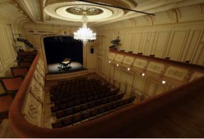
Salle du Théâtre Les Salons