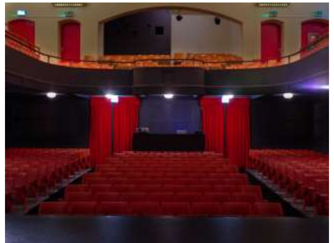
Salle du Théâtre de la Madeleine