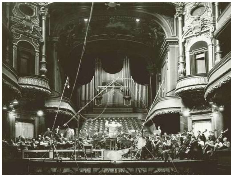
Victoria Hall - Genève

Les cartes sont réservées exclusivement aux membres du club. Vous pouvez retirer votre carte au secrétariat.