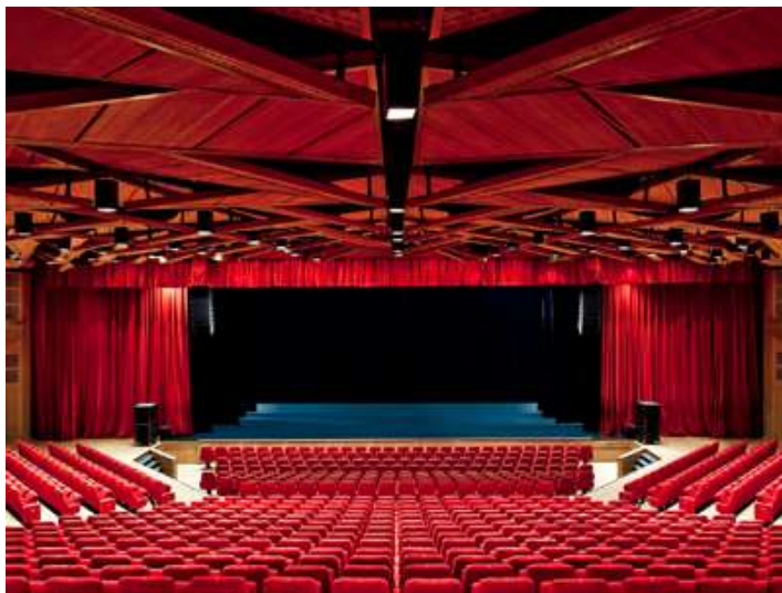
Salle du Théâtre du Léman