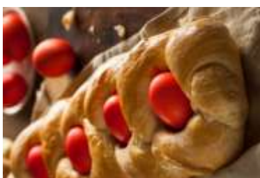
Tsoureki en Grèce