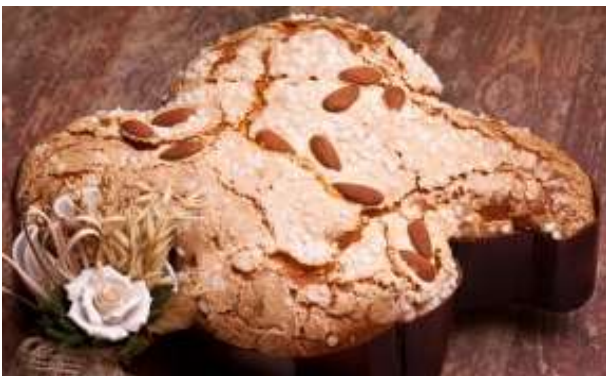
Colomba en Italie

Quelques délices de Pâques dans le monde.