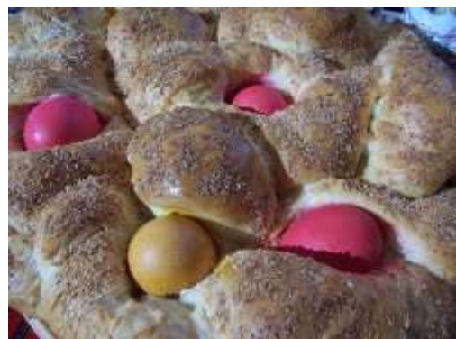
Mona en Espagne